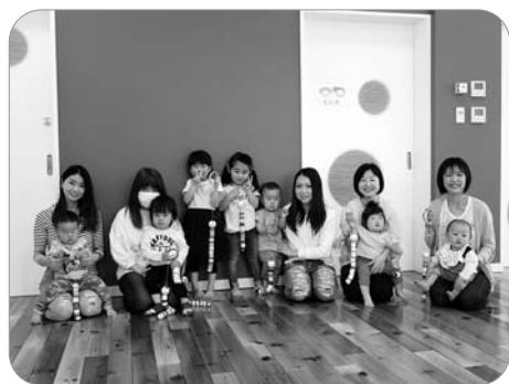
はらぺこあおむしのおもちゃ作り、みんな可愛く出来上がりました。