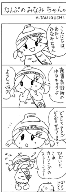
→南富良野西小学校校谷口美幸教諭作