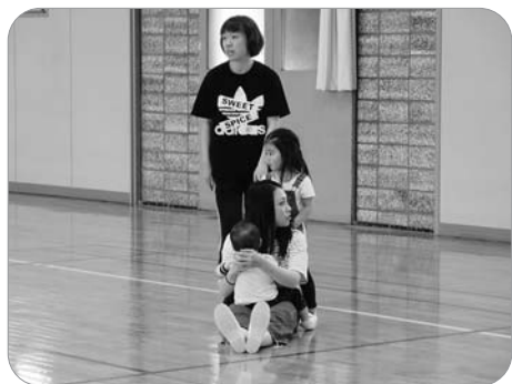
親子ふれあいダンス