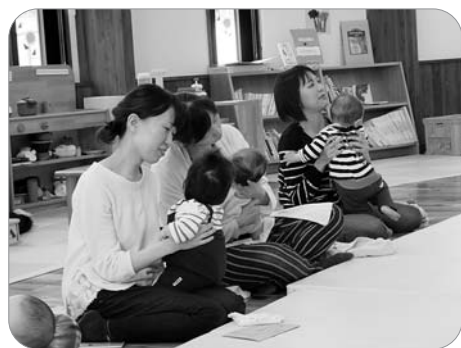
たくさんのお友達が参加してくれました。