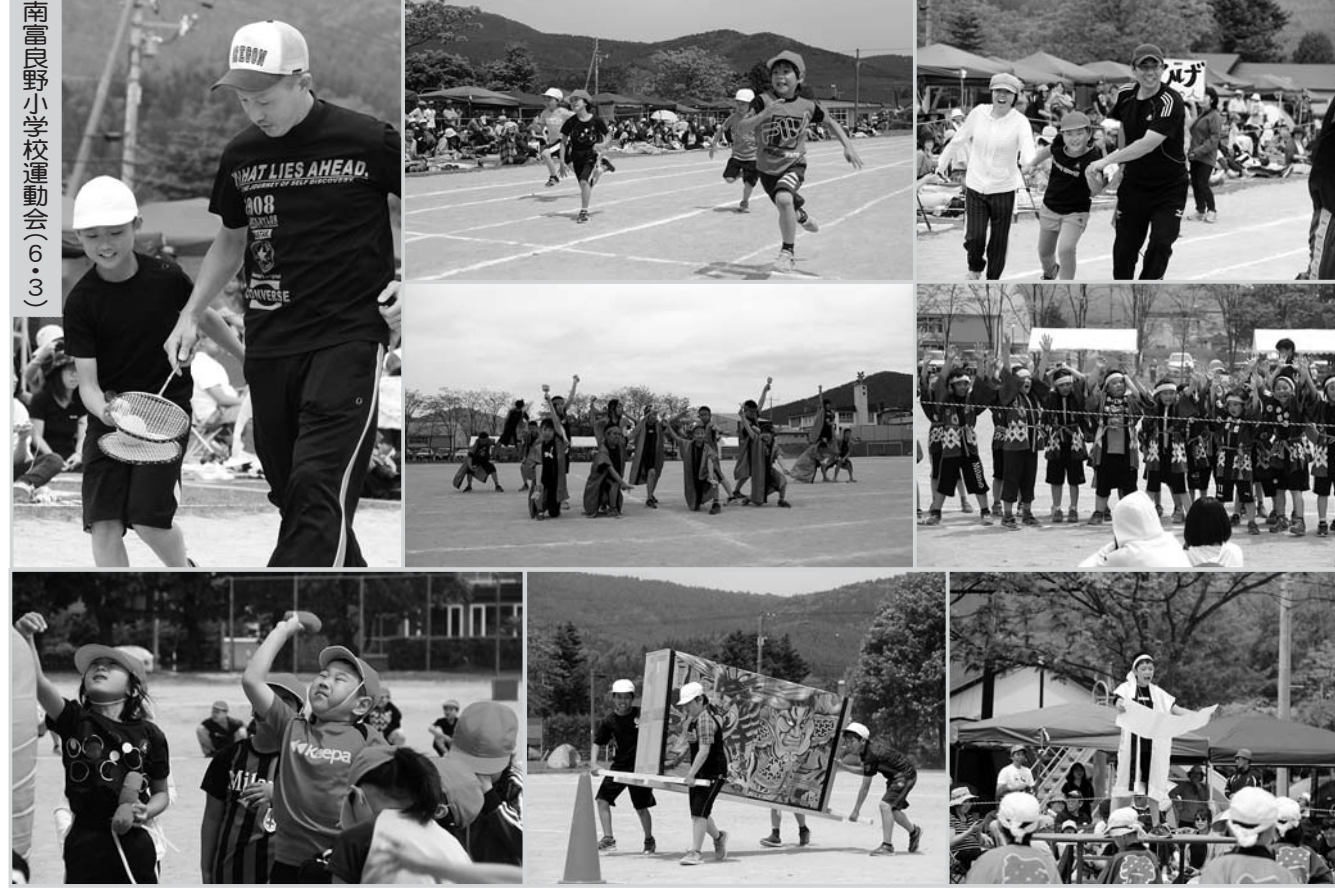
南富良野小学校運動会(6・3)