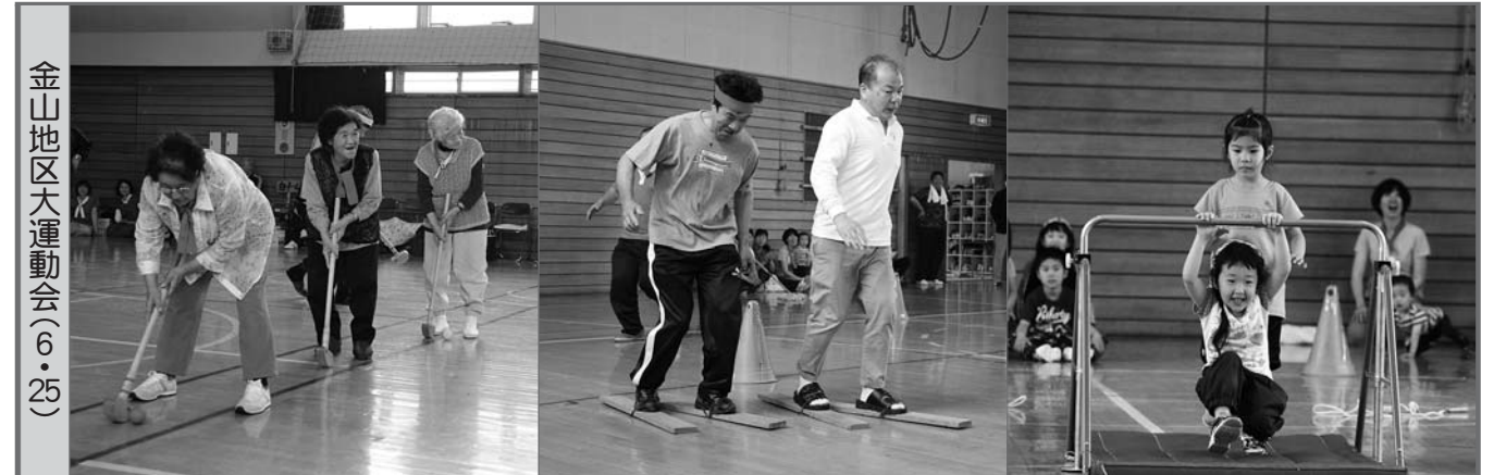
金山地区大運動会(6・25)

先月号に引き続き、金山地区と社会福祉法人南富良野大乗会で行われた運動会などの様子を紹介します。