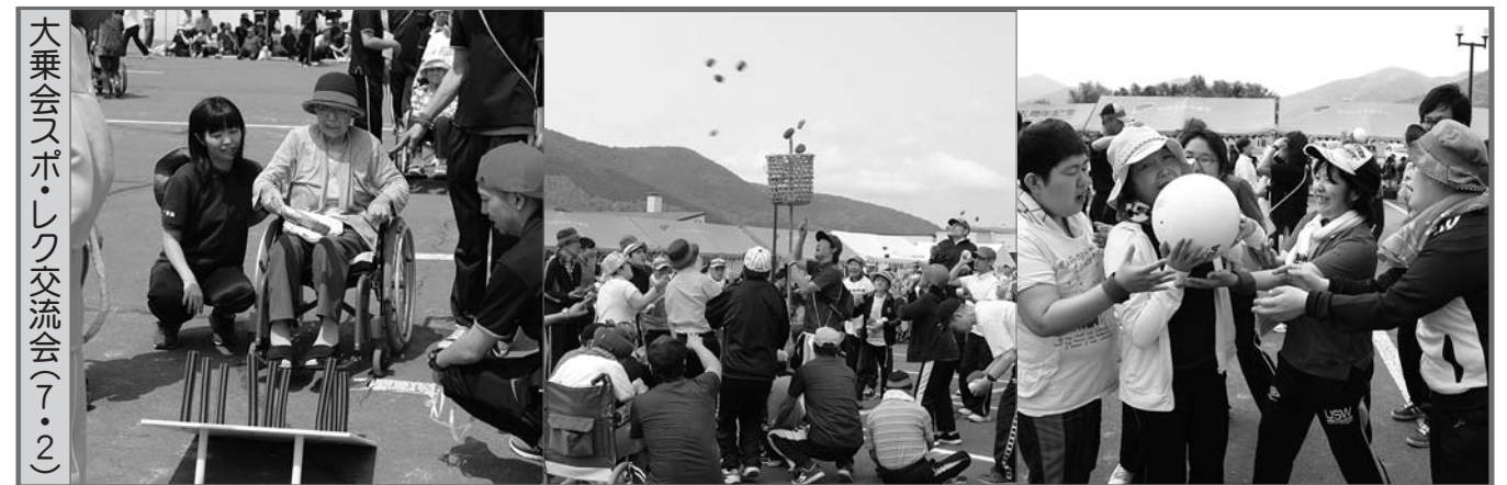
大乗会スポ・レク交流会(7・2)