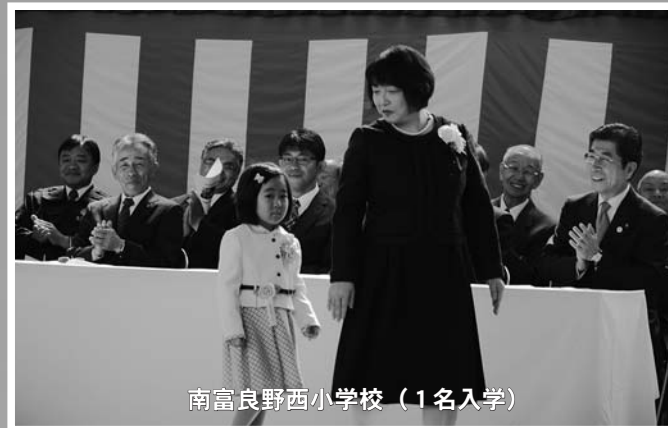
南富良野西小学校（1名入学）

4月6日、町内の小中学校において入学式が一堂に行われ、小学校2校に10名、中学校に21名の新生が入学し、在校生や父母らが見守る中、真新しい服に身を包み、新しい学校生活に心を躍らせていました。 また、4月10日には南富良野高校で入学式が行われ、町内をはじめ富良野沿線から20名の新生が将来への夢と希望を胸に、新たな学校生活が始まりました。