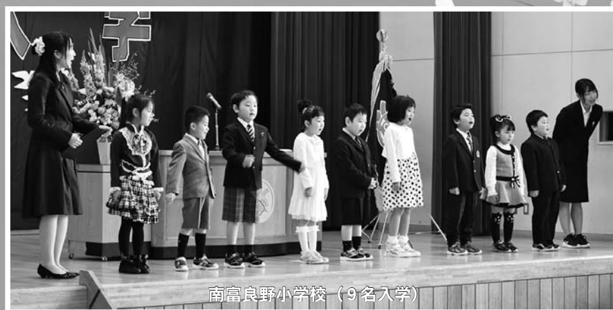
南富良野小学校（9名入学）