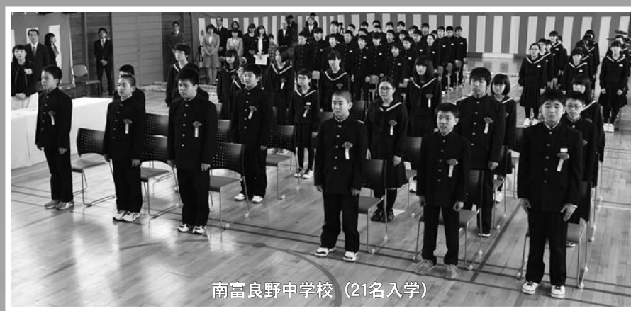
南富良野中学校（21名入学）