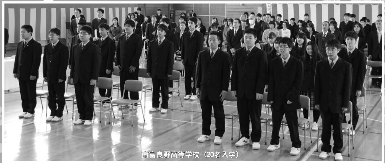
南富良野高等学校（20名入学）