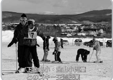
下金山小・金山小児童とのスキー交流授業