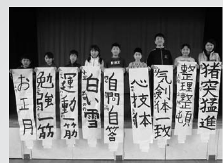
書き上げた作品をもって全員集合