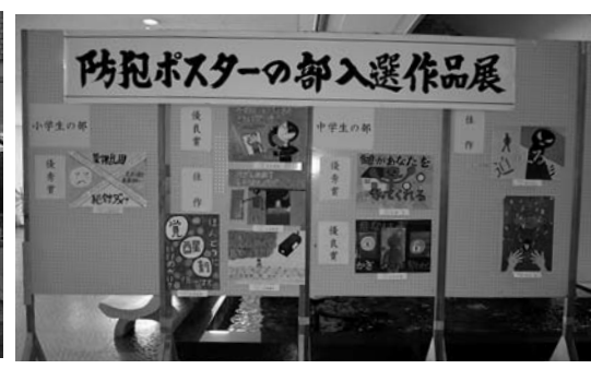
会場には入選作品が展示されました