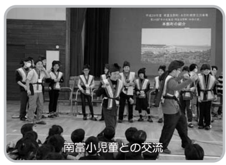
南富小児童との交流

1月27日火、交流団の一行は、午前中に南富良野小学校を訪問し、全体交流や5年生児童との交流学習が行わ