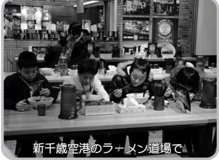
新千歳空港のラーメン道場で

「ホームステイで交流を深め、生活文化の違いを学びたいです」など一人ひとり自己紹介と抱負を発表した後、全員で元気にエイサーなどを披露し、大きな拍手を浴びていました。