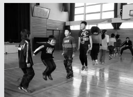
記録を伸ばそうと、歯を食いしばる下金っ子

下金山小学校 思い思いの言葉を書き初めに 1月9日、下金山多目的センターで「かるた・書き初め交流会」が行われました。下金山地区の子どもたちは、午前書き初めにチャレンジ、年頭の伝統行事にお父さんやお母さん、地域の方にも参加いただきました。どの子どもも自分の好きな言葉や努力したいことなどを、太い筆でのびのびと書き表すことができました。お昼はお母さんの愛情いっぱいのおにぎりや豚汁が振る舞われました。午後は百人一首を楽しみました。書き初めの作品は、多目的センターと下金山小学校に掲示し、地域の方に見ていただきました。 冬は縄跳びで体力づくり 1年間を通して、体力づくりに取り組んでいます。全校で取り組んでいる運動は、1学期は一輪車、2学期はマラソン、そして3学期は縄跳びです。縄跳びには、三つの挑戦があります。跳び方や回数に挑戦「なわとび検定」、三分間に何回跳べるか挑戦「三分なわとび」、同じく三分間で集団で何回跳べるかに挑戦「三分長なわ」です。縄跳びの取組は、北海道教育委員会「どさん子元氣アップチャレンジ」にもエントリーしています。記録に練習の成果が表れた時はにっこり笑顔！下金っ子の挑戦は続きます。