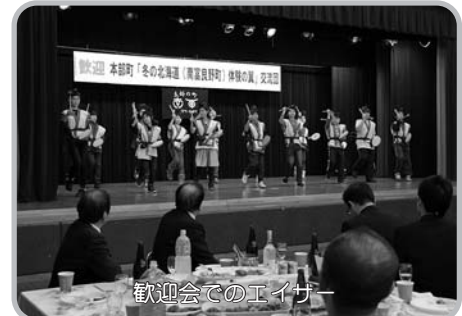
歓迎会でのアイス

000名を超える人々が交流を続けてきました。沖縄では経験できないスキーやカーリングを体験するため、本部町の将来を担う子ども達を連れて来ました。氷点下の北海道、雪を初めて見る児童も多く、期待に胸を膨らませています。今後ともこの交流事業が発展継続できるよう努力してまいります」と高良文雄本部