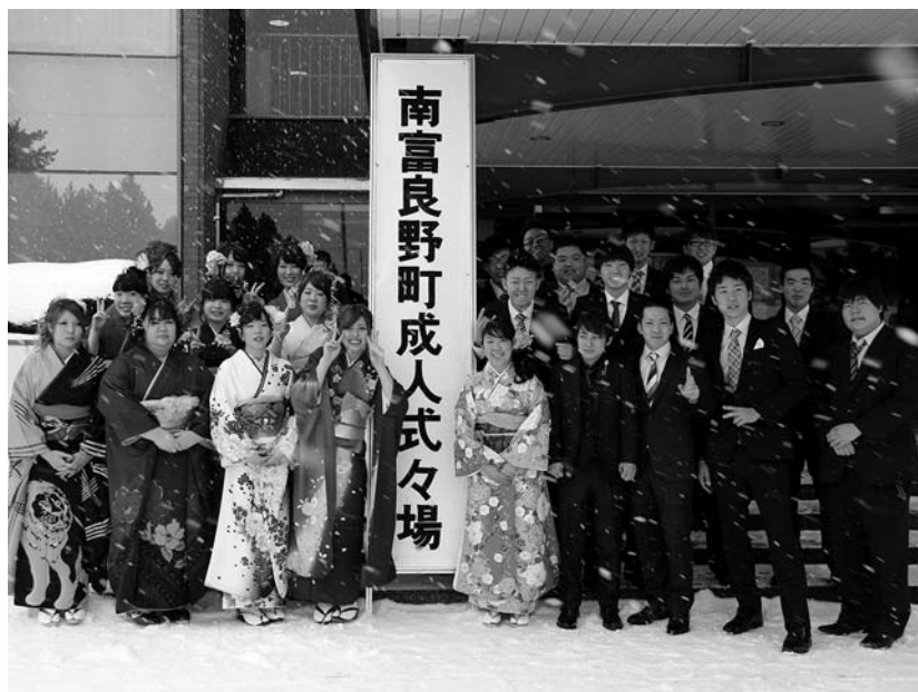
南富良野町成人式々々場