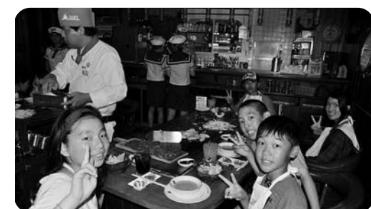
サムズアンカーイン

マリントラックでは、バナナボートに乗りました。バナナボートはとても早くまがる所では落ちそうになりましたが落ちませんでした。とても楽しかったです。