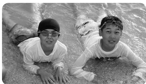
グリーンフラッシュビーチ

全部失って、つらいことばかりなので、ぜったいにやっつけていけないものだと思います。