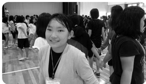
本部小児童との交流

理由は大きなジンベエザメを見ることができたからです。美ら海水族館の主な展示を紹介いたします。