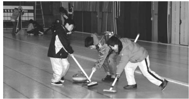
町カーリング少年団

国の平成20年度補正予算で急速に悪化している国内景気や雇用情勢の緊急対策として交付される、地域活性化生活対策臨時交付金を活用した繰越事業として、安全を確保するため老朽化が著しい旧高 schools 解体工事と、町民体育館利用者の利便性を確保するために体育館の照明器具を昇