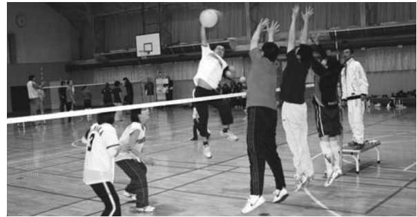
町民ミニバレーボール大会

次に、体育、スポーツの振興についてであります。町民が生涯にわたり心身ともに健康で明るく充実した生活を営むことができるよう、個々の生活の中に積極的に取り入れて、体力づくりや健康増進