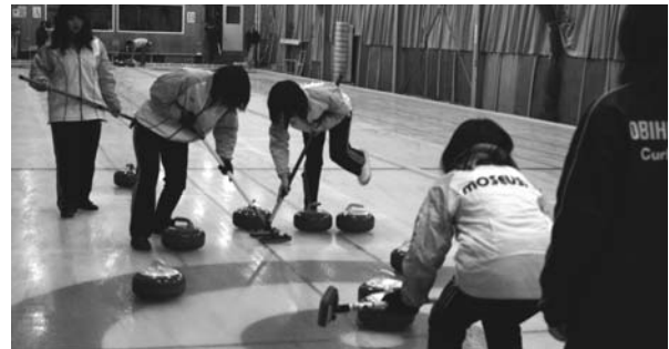
町ジュニアカーリング選手権大会